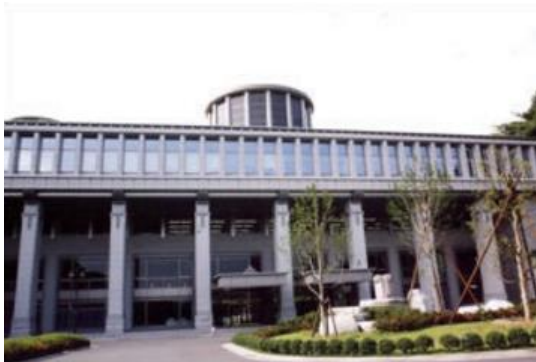
専修大学 生田キャンパス 120年記念館

明治13（1880）年、日本の私学では初めて専門教育課程を組織的に日本語で教える「経済科」と「法律科」を併設した専修学校として創立し、2009年には創立130年を迎える専修大学。専修大学では、教職員向けの人事・給与システムとして、新たにカシオの「アドプス人事統合システム」を導入、法令改正等、制度変更への迅速な対応や人事・給与関連業務の効率化を実現した。そして、大学の本業である教育関連業務に一層注力できるようになり、21世紀ビジョンとして掲げている「社会知性の開発」の実現に向けた人事制度改革も進められるようになった。